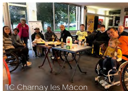
TC Charnay les Mâcon

Les clubs ont proposé des ateliers de découverte et un temps de partage pour informer et présenter cette discipline au public. Pour rappel, les objectifs de cette journée, étaient les suivants :