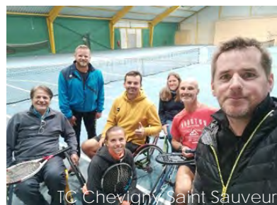
TC Chevigny Saint Sauveur