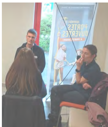
SAINT FLORENTIN, 2 avril

Les ateliers proposés permettent à chacun de découvrir l'Ecoute Active, élément fondamental de la communication interpersonnelle et de la gestion de projet associatif.