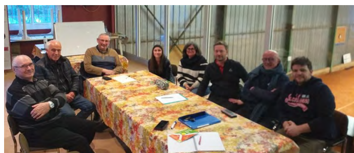
AUTUN, 3 avril

« Comment tu te vois dans ton club dans 5 ans ? »