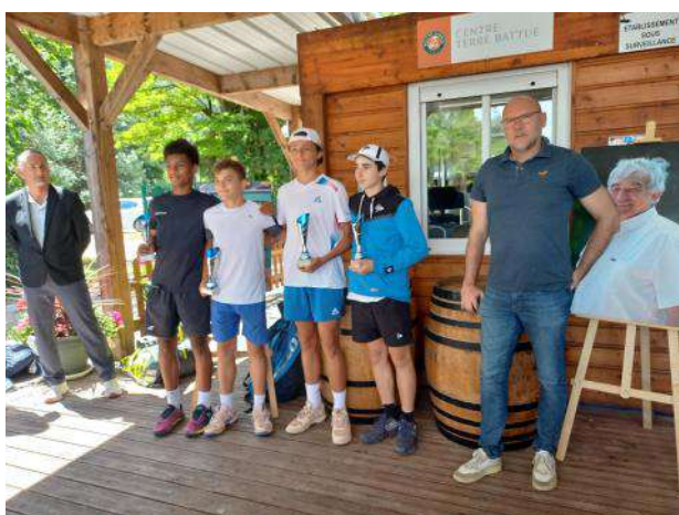
LATRUBESSE V / PHITOUSS J. battent AGNITHEY L / VUKOVIC M 6/1 6/4