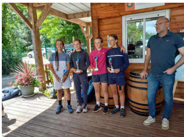
DOURNES C / LE PRUNENEC A battent DEPREZ M / GUILBERT C 6/1 6/3