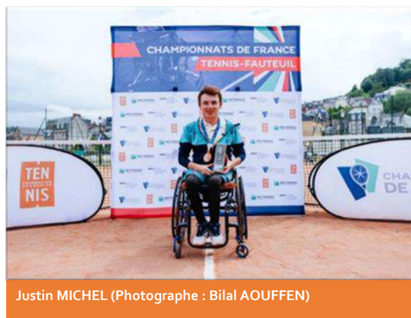
Justin MICHEL