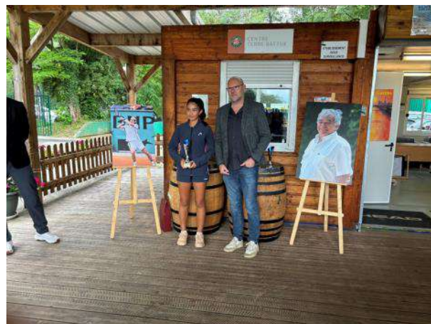
ÇUKURLUOGLU Z. bat ZHAN CHOLET S 6/3 6/3